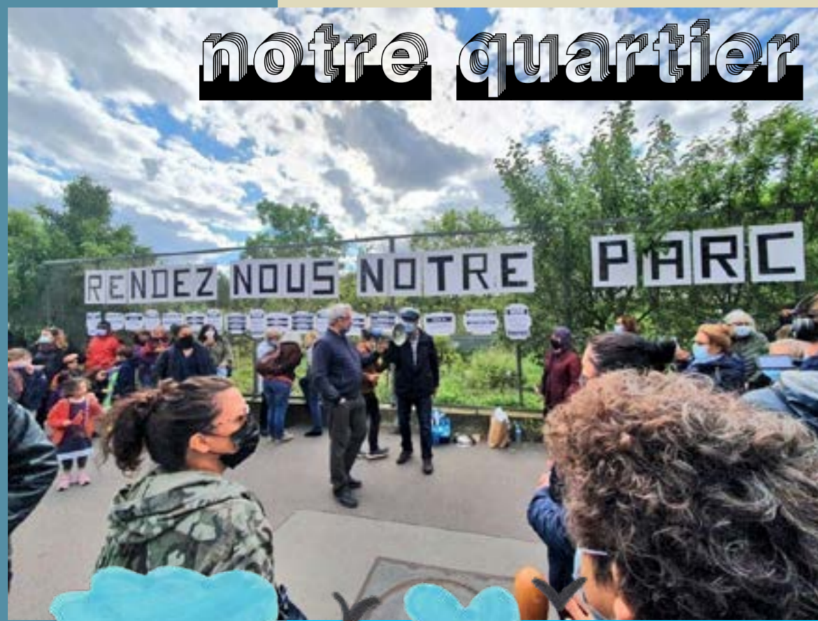
Des manifestants au Jardin d'Eole le 19 mai