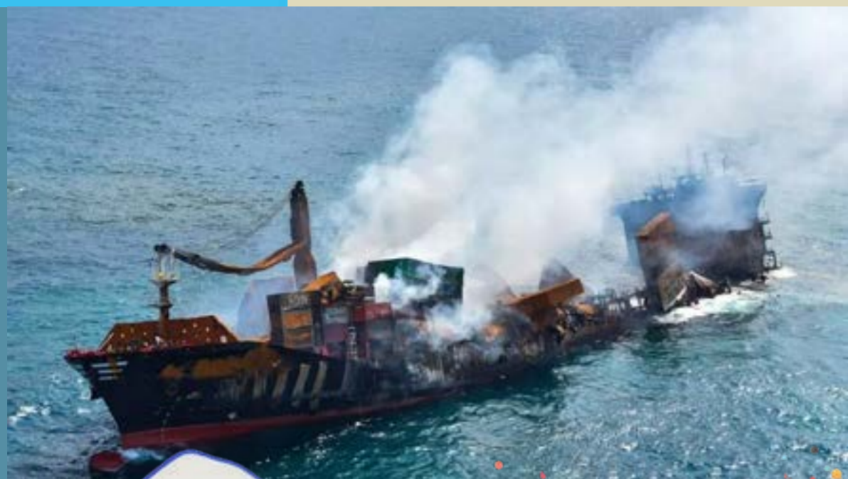
A gauche : le porte-conteneurs MV X-Press Pearl en train de couler, le 2 juin 2021