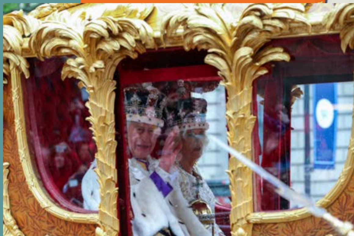
Le roi Charles III et la reine Camilla dans leur carrosse

Charles III, le fils de la reine Elizabeth, a été couronné le samedi 6 mai (pendant les vacances) il est donc devenu le nouveau roi d'Angleterre. On a suivi la cérémonie en vidéo, on vous raconte comment cela s'est passé.