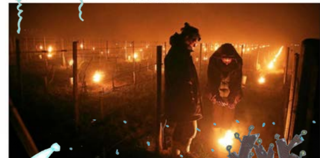
Le Télégramme Capture d'écran le 4/04/2022

Il fait très froid depuis une semaine. Vendredi dernier il a même neigé alors qu'on était déjà au printemps. C'est problématique parce qu'au printemps il y a déjà des bourgeons sur les branches des vignes, des cerisiers et des autres arbres fruitiers.