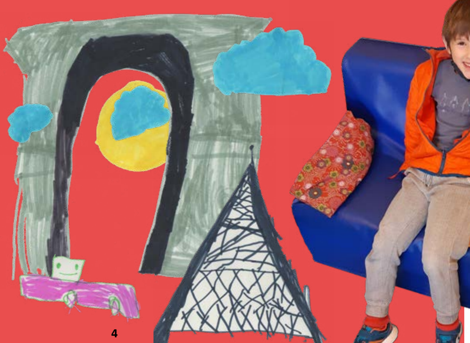
Pendant 16 jours, l'Arc de Triomphe a été recouvert d'une belle robe blanche avec des fils argentés.